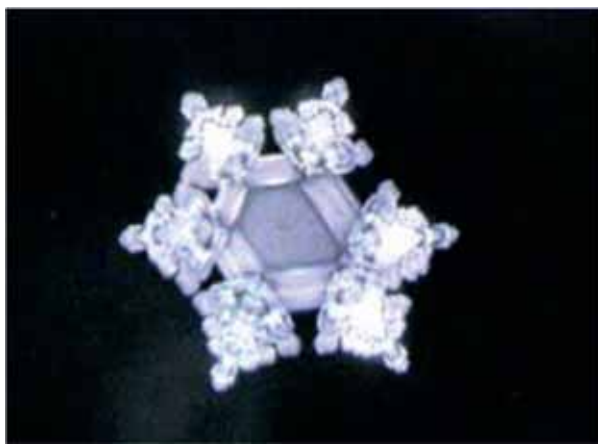
Вода источника близ озера Тюдзэндзи

Одно из самых необычных и загадочных свойств воды – умение запоминать и сохранять любую благоприятную или неблагоприятную информацию. Вода имеет кластерную структуру. Комбинаций кластеров существует великое множество: прекрасных, гармоничных и разрушенных, некрасивых. Имеют значения слова, мысли, чувства – информация. Что несёт она, добро или зло; созидание или разрушение. Это явление, хотя японцы знали о нем давно, было исследовано и открыто заново опять-таки японскими учёными во второй половине 20-го века. И вот что показали снимки различной структуры воды в зависимости от «услышанной» жидкостью информации: