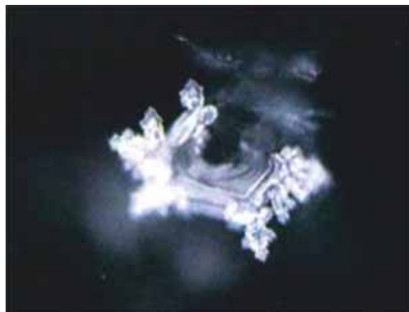
Та же вода, обработанная хлором